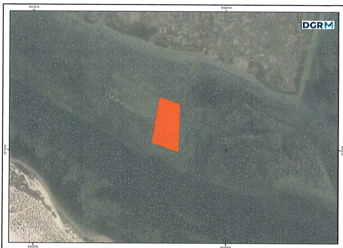
Figura 1 – Planta de localização do PNRF 1085

O procedimento a realizar terá, nos termos do artigo 13.º-B do Decreto-Lei n.º 40/2017, de 4 de abril, na sua redação atual, os seguintes critérios de seleção e ordenação das propostas, indicando-se a respetiva valoração numa escala de 0 a 100 pontos: