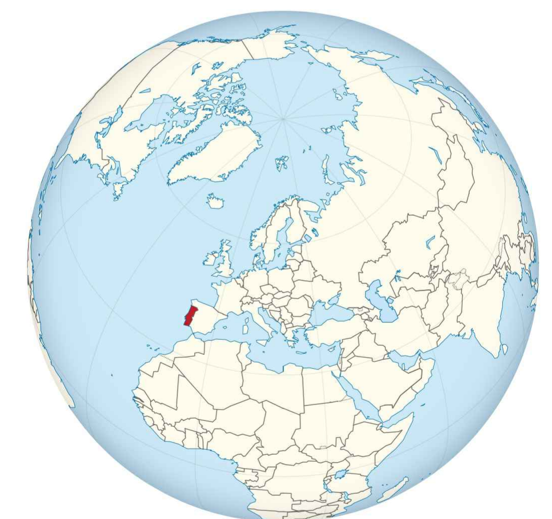
PORTUGAL NÃO ESCALA