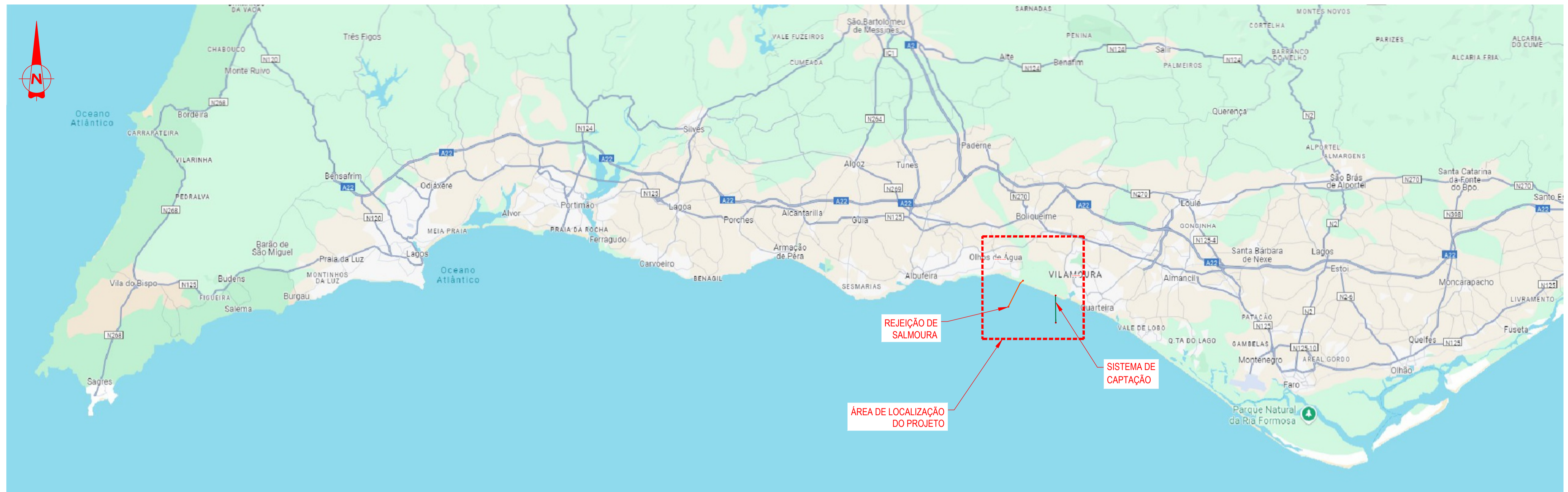
ÁREA DE LOCALIZAÇÃO DO PROJETO ESCALA 1:15.000