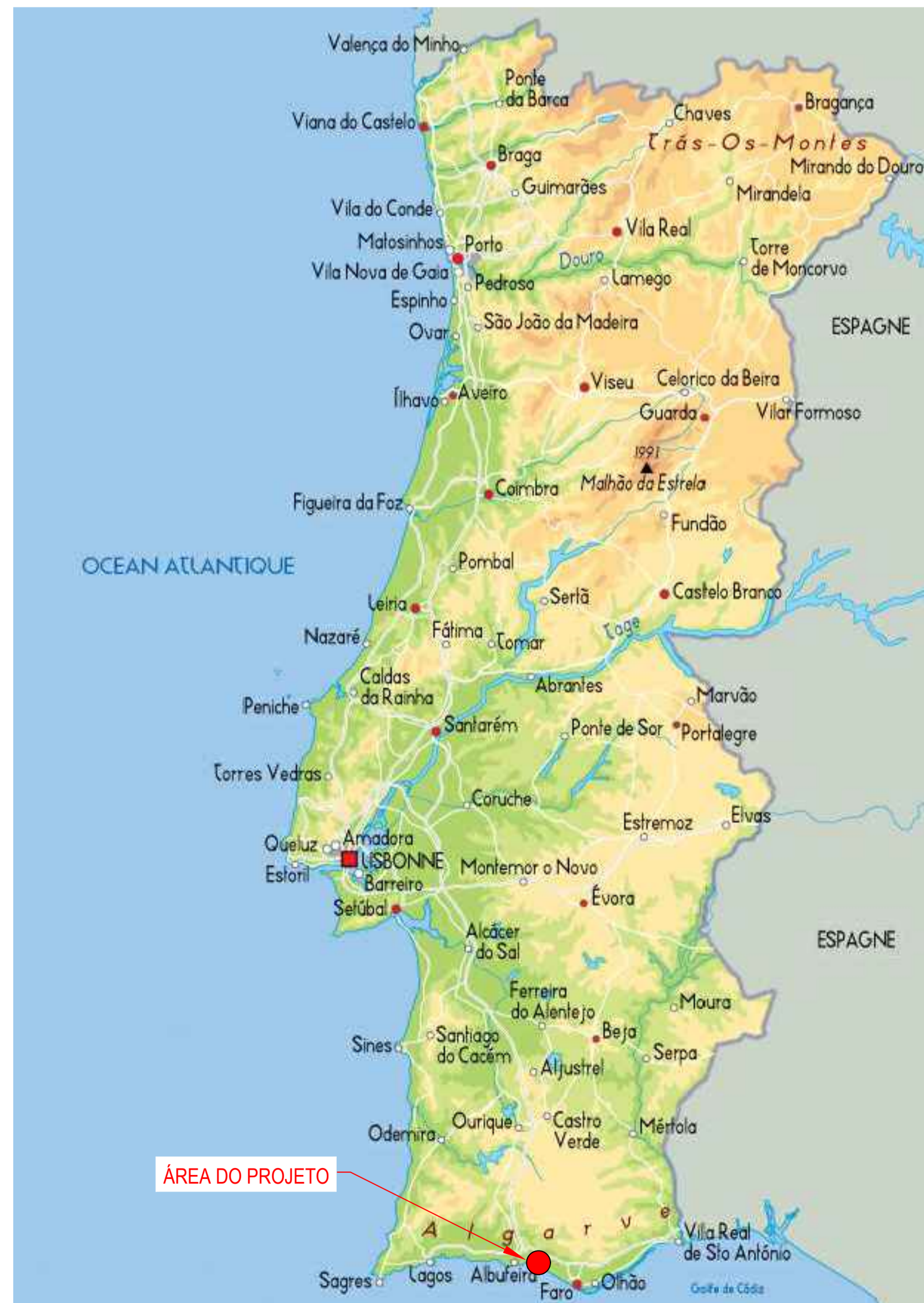
MAPA DE PORTUGAL NÃO ESCALA