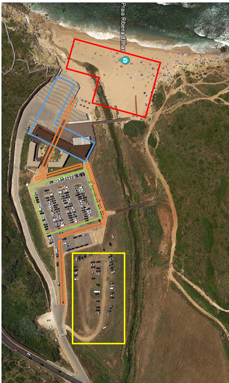
Imagem 1 - Setorização zona de Ribeira D'Ilhas